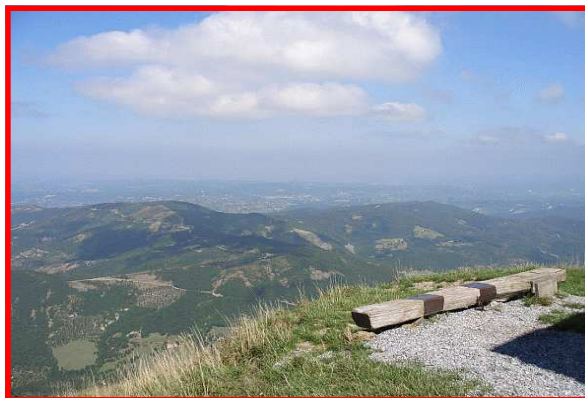
Panorama dal Monte Tobbio

Il Servizio Parchi individua i sentieri più significativi degli 8 settori al fine di promuovere forme di turismo a basso impatto ambientale e una migliore conoscenza del nostro territorio.