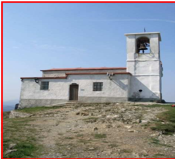
La chiesetta sul Monte Tobbio

Linea ferroviaria per Novi o Busalla + Autobus di linea ( www.citnovi.it ) per Voltaggio