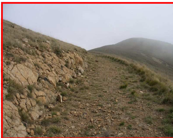
Il sentiero sale in quota

Seguire direzione Gavi Voltaggio e seguire la SP 165 per capanne di Marcarolo