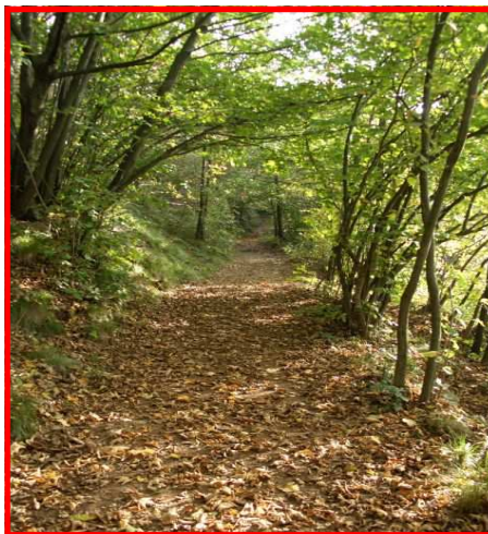
Il sentiero attraversa il bosco

Il Servizio Parchi individua i sentieri più significativi degli 8 settori al fine di promuovere forme di turismo a basso impatto ambientale e una migliore conoscenza del nostro territorio.