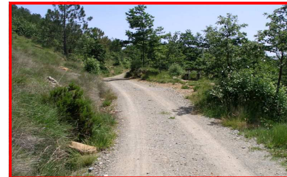
La strada verso la Cascina Menta